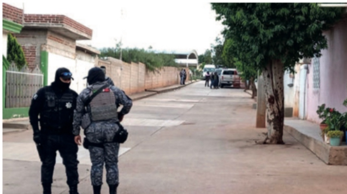
Aquí, en Pozo de Gamboa, Pánuco, Zacatecas, fue la horrenda masacre

PERO SÍ, los ocho asesinatos ocurrido la tarde del sábado en Pozo de Gamboa, Pánuco, fue una masacre. Los habitantes de ese municipio tan cerca de la capital del estado no recuerdan caso parecido, ni en la Revolución Mexicana.