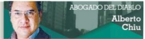
ABOGADO DEL DIABLO

En un estado como el nuestro, donde vemos que el crecimiento de la industria de manufactura, o el comercio, o los servicios, nomás no logran crecer, los empleos gubernamentales se han convertido en una atracción enorme