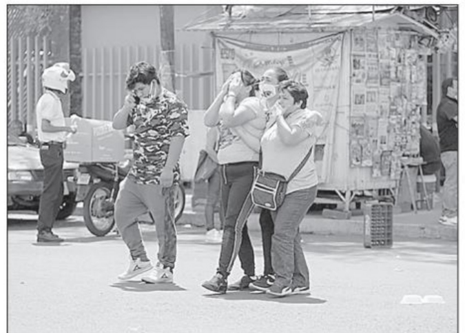
Los efectos que la pandemia está dejando tras de sí, exigen una nueva visión en relación a los sistemas, órdenes de vida, y los órdenes administrativos, afirma colaborador

En tiempos de crisis vale más ser ágil y eficiente, que grande y fuerte.