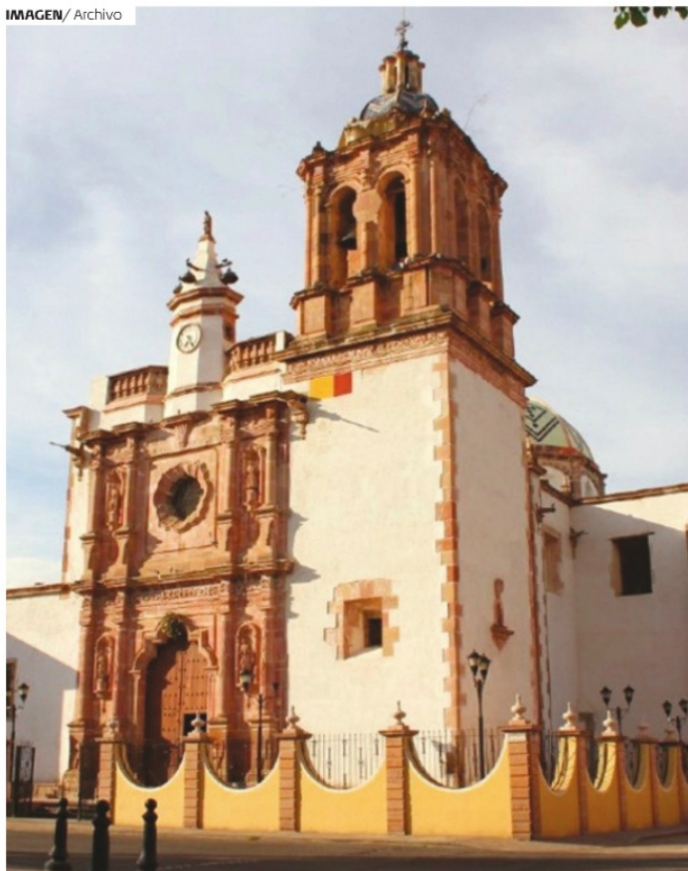
EL CLUB Amigos de Fresnillo tiene la obra y las historias de Villanueva presentes.

las imprescindibles anécdotas. No descuida los piropos ni lo que se oía en el templo y la aventura en el cine.