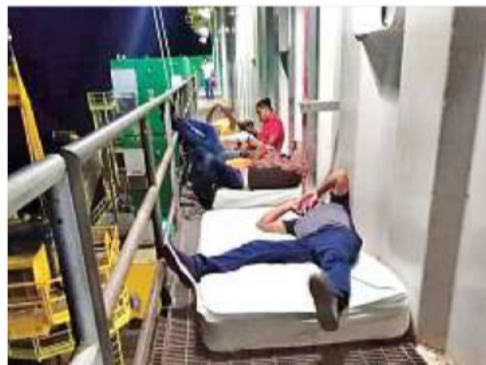
Los trabajadores en las plataformas marinas duermen a la intemperie porque no funcionan los aires acondicionados.

El diagnóstico presentado a Pemex, del cual REFORMA posee copia, detalla una serie