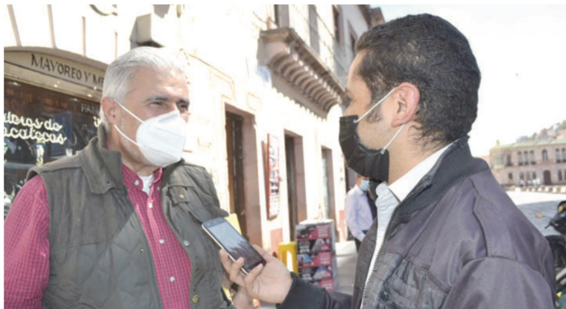
José Narro Céspedes, senador de la República: “Es profundamente lamentable que, con todo lo que está pasando, no se haga nada”

* “Está Paralizada la Economía y ha Ahuyentado al Turismo”