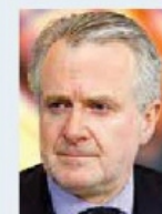
Santiago Creel Miranda