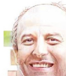
Ilustración: Horacio Sierra

Guillermo Calderón se especializa en desarrollo de proyectos, como demostró al consolidar el Metrobús. Su nuevo desafío es enorme: dirigir al Metro capitalino. / 17