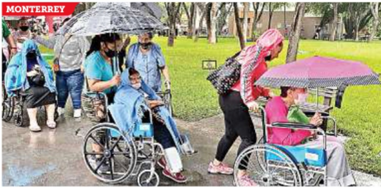
■ Pese a sus discapacidades, adultos mayores deben acudir a cobrar personalmente sus apoyos.