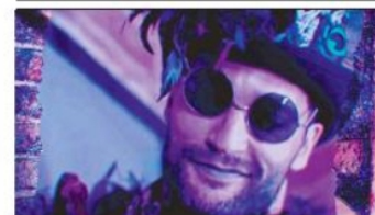
CURTISIA: PETROL / UIM

VENECIA. Los ministros de Finanzas del G20 aprobaron un acuerdo "histórico", con el objetivo de poner fin a los paraísos fiscales. Pág. 22