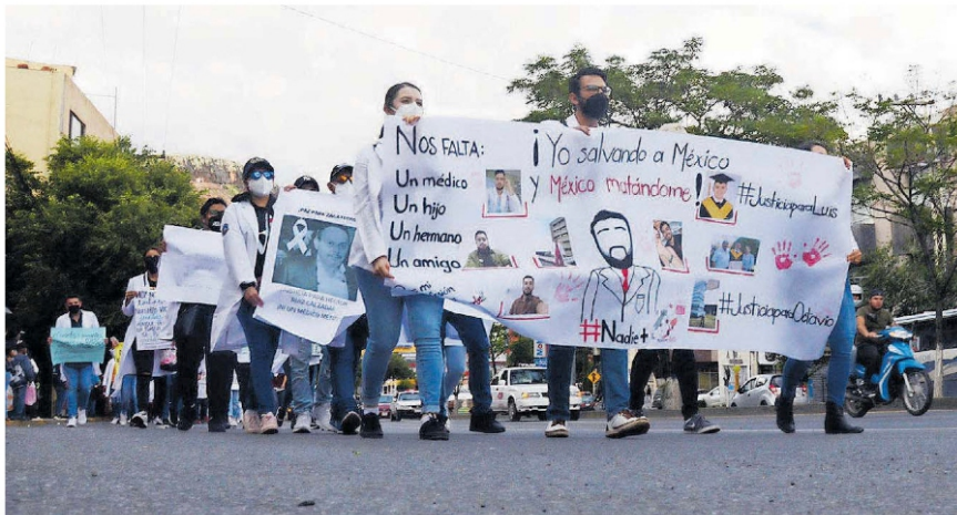
Pasantes de medicina y estudiantes, en la Marcha por la Paz de Zacatecas.

Bajo el lema de "Ni un médico más", los manifestantes que llevaron un moño negro en su bata blanca, denunciaron las condiciones precarias con las que prestan