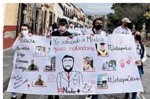
■ Decenas de personas se manifestaron ayer en Zacatecas por los asesinatos de dos médicos en menos de 10 días.

"Basta de inseguridad, exigimos un freno a la violencia y una mayor protección para los trabajadores de salud, cuya loable labor es dar