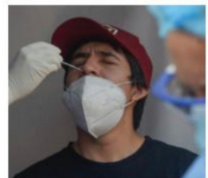
Acuden jóvenes y hasta niños.