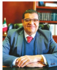
ERIK MUÑOZ, secretario General de Gobierno.

De aprobarse, esa complementariedad se le aplicará de forma total a la burocracia que se rige por la Ley del IMSS de 1997; para los que aplican con la ley de 1973, "se establece un marco de aplicación gradual de la complementariedad, en función del número de años faltantes para alcanzar los requisitos establecidos en la norma". Es decir, si les faltan 9 años se les consideraría el 45% de la pensión que recibirían del IMSS para completar la del Issstezac; si son 8 años sería el 40%, a los 7 años el porcentaje baja a 35 y así sucesivamente.