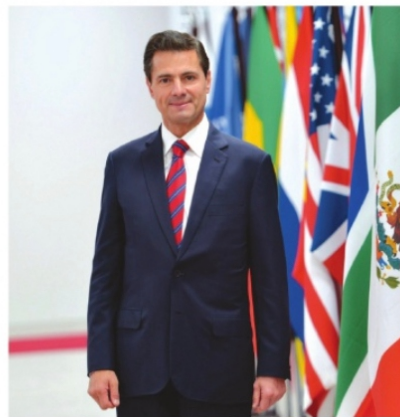
ENRIQUE PEÑA NIETO , expresidente de la República.