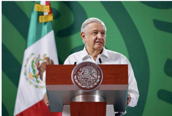
Andrés Manuel López Obrador, presidente de México: La Consulta Ciudadana es constitucional

en una ocasión cada tres o cada seis años.