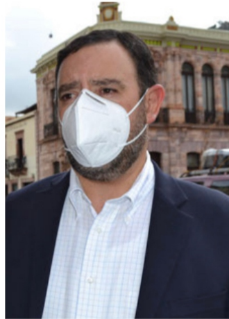
Alejandro Tello Cristerna