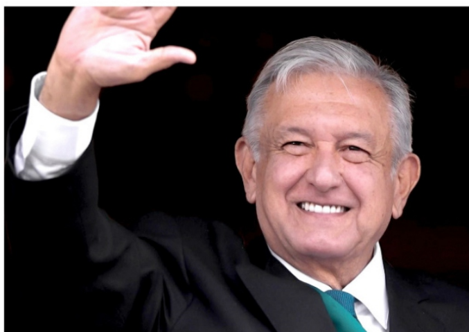
ANDRÉS MANUEL LÓPEZ OBRADOR, presidente de México.

La tortura surte en muchas de las víctimas, el efecto de atemorizar a la víctima, las vejaciones despojan de la dignidad y auto-estima, no solo se cede a asumir falsas culpas, se renuncia a valerse de la ley para reclamar justicia, cuando