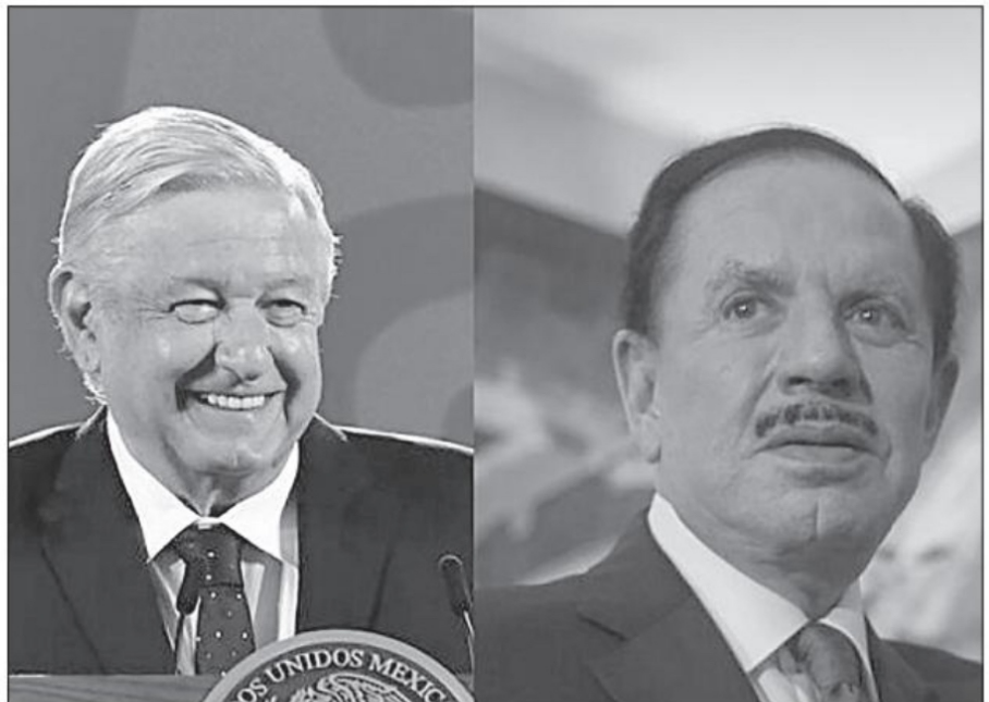
El presidente AMLO ha cuestionado las portadas de 'El Universal'

@villanuevamx ernesto.villanueva@proceso.com.mx