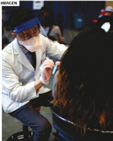
LA VACUNACIÓN, clave para la reactivación.