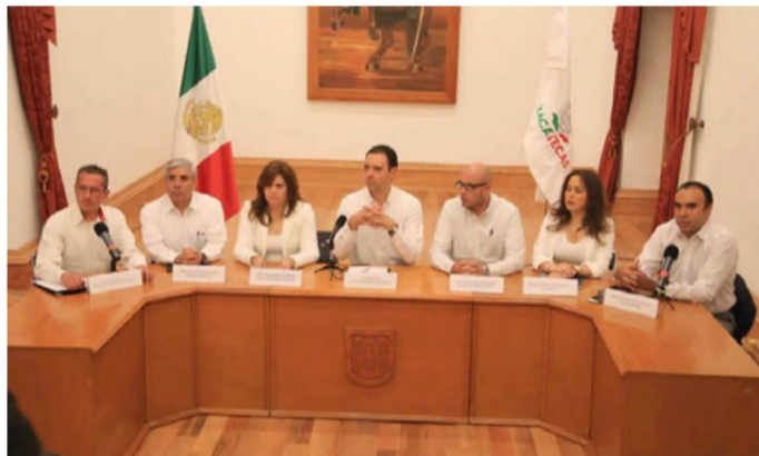
Alejandro Tello Cristerna, su Gabinete de Seguridad y su propagnadista: "Investigaremos a Fondo y Castigaremos Todos los Delitos"

por la Cananea, cuando de repente hizo su aparición un automóvil y le dispararon en varias ocasiones y rápidamente se perdieron bajo las sombras de la noche”.