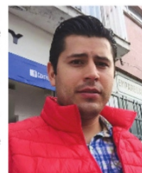
JULIO CÉSAR CHÁVEZ, alcalde electo.