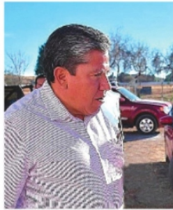
DAVID MONREAL , gobernador electo.