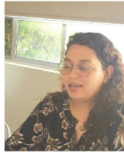
GABRIELA RODRÍGUEZ , titular de la Función Pública.

Y para reaccionar ante las batallas entre grupos criminales, el funcionario dijo que se requiere de la cooperación de los tres niveles de gobierno. Parte de esa ayuda mutua sería en temas de coordinación y compartir información, aunque en el caso de los ayuntamientos poco pueden hacer para enfrentar a