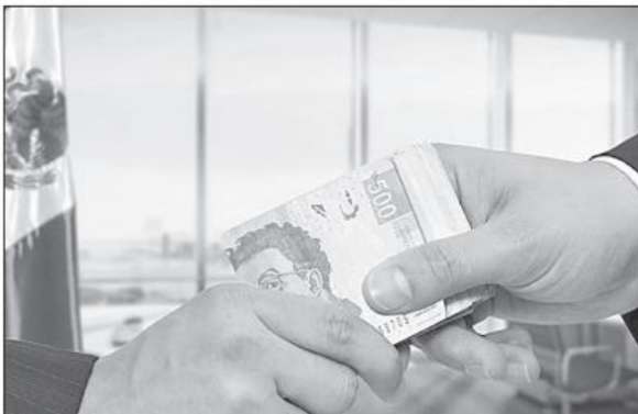
En México, la impunidad por la falta de sanciones administrativas a servidores públicos es mayor a 90% y afecta la calidad de los servicios que presta el Estado