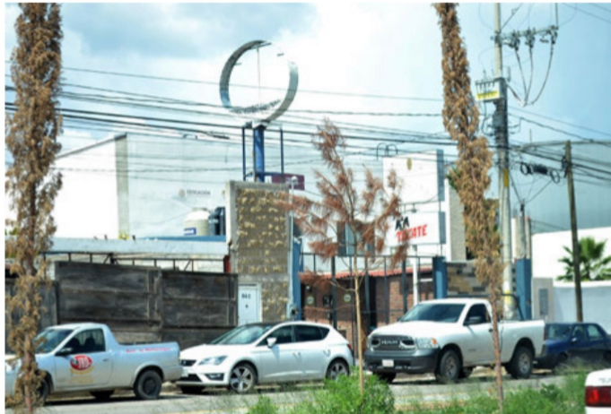
Restaurante-bar Santo Cántaro: Aquí asesinaron a tiros a cuatro clientes