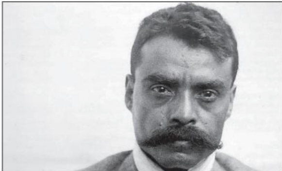
El lunes y martes de esta semana celebramos el 142 aniversario del natalicio de nuestro General Emiliano Zapata

Trabajamos por un mejor México y nuestra herramienta es la 4T, con ella haremos realidad las utopías que nos han costado la sangre de miles de mexicanos que, desde la izquierda, dieron su vida y sus esfuerzos para que nosotros alcancemos la victoria. Estamos comprometidos con quienes nos precedieron y con la fuerza de la gente. La base social de la Cuarta Transformación, su gente, es la que nos constituye. Somos cada hombre y mujer que creyó y cree que un mejor México es posible. Llamamos a cada mexicano a no olvidarse del trabajo de a pie. Esa es la única forma de que la 4T tenga un futuro y esto es nuestra responsabilidad. ■