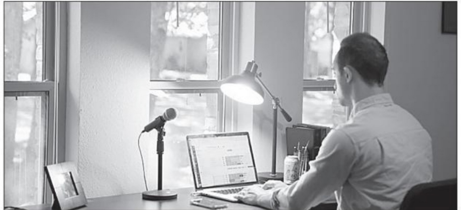
Finalmente tenemos una computadora en las manos, nuestro teléfono celular, el cual hace un número extraordinario de funciones que incluso, supera lo que pueden hacer las computadoras de escritorio

La tecnología actual es verdaderamente asombrosa. Dictarle a una aplicación telefónica, que convierta lo que se ha dicho por el micrófono del teléfono a texto es increíble y habla del gran trabajo que se ha hecho en la interacción hombre/máquina, vía a través de comandos de voz. La ciencia se muestra poderosa y hoy lo es más al dar acceso a mucha más gente que antes. ■