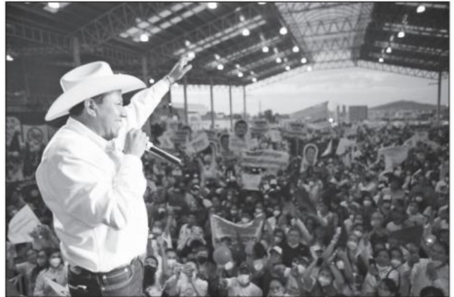
El estado de Zacatecas renovará el aparato de gobierno con la llegada del nuevo gobernador (David Monreal), quien, según él mismo lo ha dicho, vendrá montado en la maquinaria política de la Cuarta Transformación