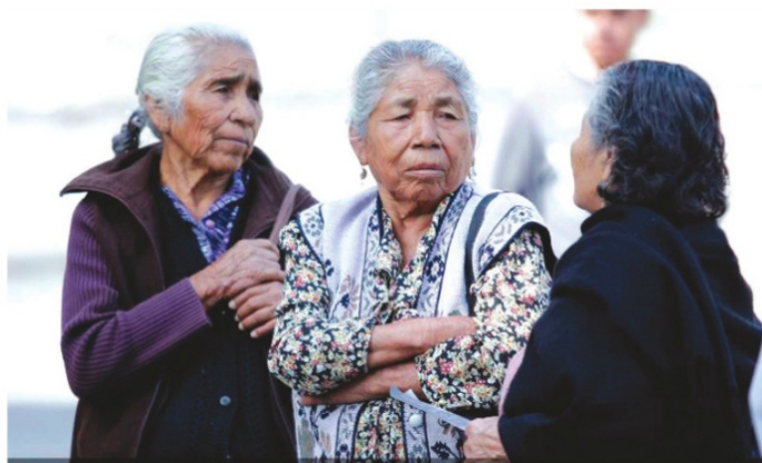
BUSCABAN que los adultos mayores no quedarán desprotegidos.

Fue en ese tiempo que la Cruz Roja se muda a sus nuevas instalaciones fuera de la ciudad y la casona se queda abandonada.