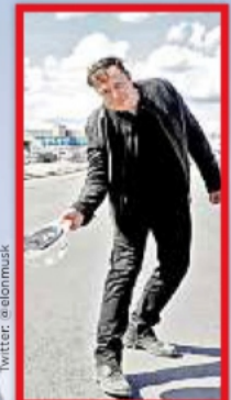
ELON MUSK En Boca Chica.