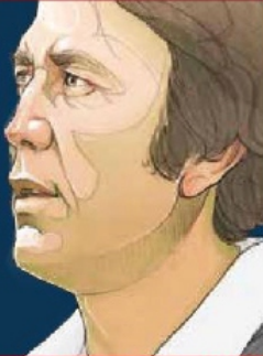
Ilustración: Horacio Sierra

Tom Flores, hijo de mexicanos y ganador de cuatro Super Bowls, ya tiene su lugar en el Salón de la Fama. / 8 y 9