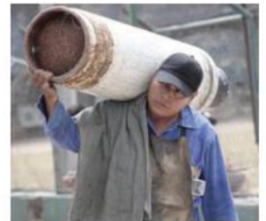
Regularización sin paros.

Orden. Gaseros del Valle de México iniciaron este sábado la integración del padrón acordado con la Profeco, con el objetivo de regularizar su situación mientras que se alistan mesas de diálogo con las empresas gaseras para establecer la distribución del energético y un tope máximo en su precio, con el compromiso de eliminar amenazas de más paros. PAG 6