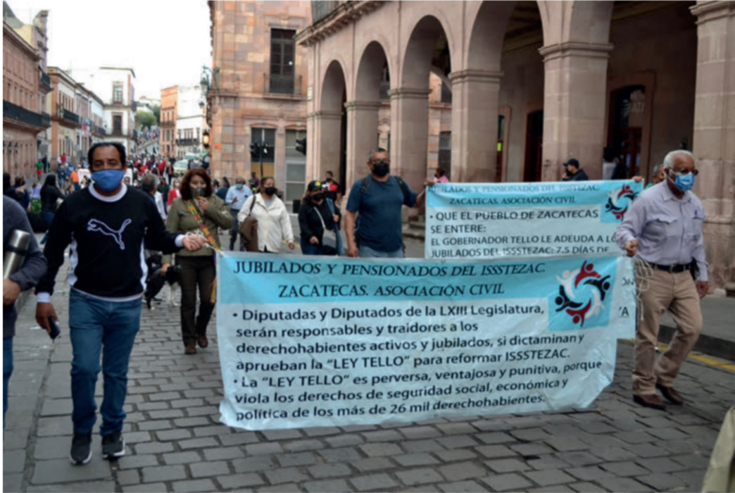
Más de 10 mil manifestantes ganaron las calles del centro de Zacatecas, para repudiar y exigir a diputados no aprueban la novicia y perversa “Ley Tello”

“ EL GOBERNADOR Alejandro Tello asentó que la reforma del Instituto de Seguridad y Servicios Sociales de los Trabajadores del Estado de Zacatecas (Issstezac) y la solución a los problemas que vive este organismo están en manos de la Legislatura local.