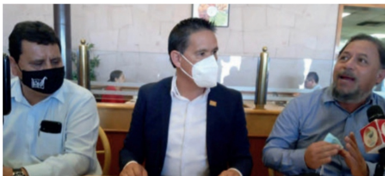
Anunciando la protesta