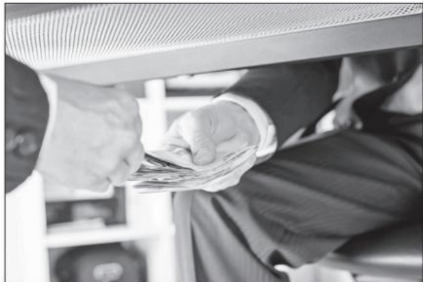
La corrupción es un reto impresionante: socava al Estado desde sus cimientos, al impedir, como fenómeno más allá de sus muros, las bases de su funcionamiento