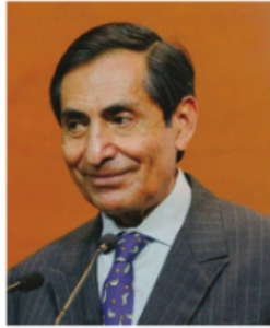
ROGELIO RAMÍREZ , secretario de Hacienda.