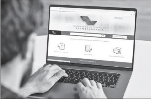
La Plataforma Nacional de Transparencia es una de las más grandes y trascendentes políticas de Estado en México