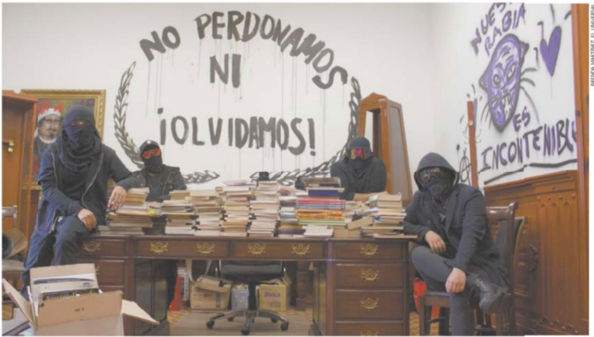
A un año de la toma de las instalaciones de la CNDH en la Ciudad de México, las okupas, sin mostrar su rostro ni decir su nombre, cuentan que todo comenzó con un sueño de brindar apoyo y un refugio a cualquier mujer o infancia que lo necesite. A2 |