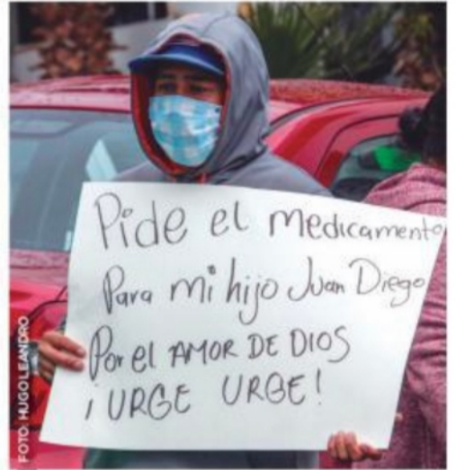
Padres de niños