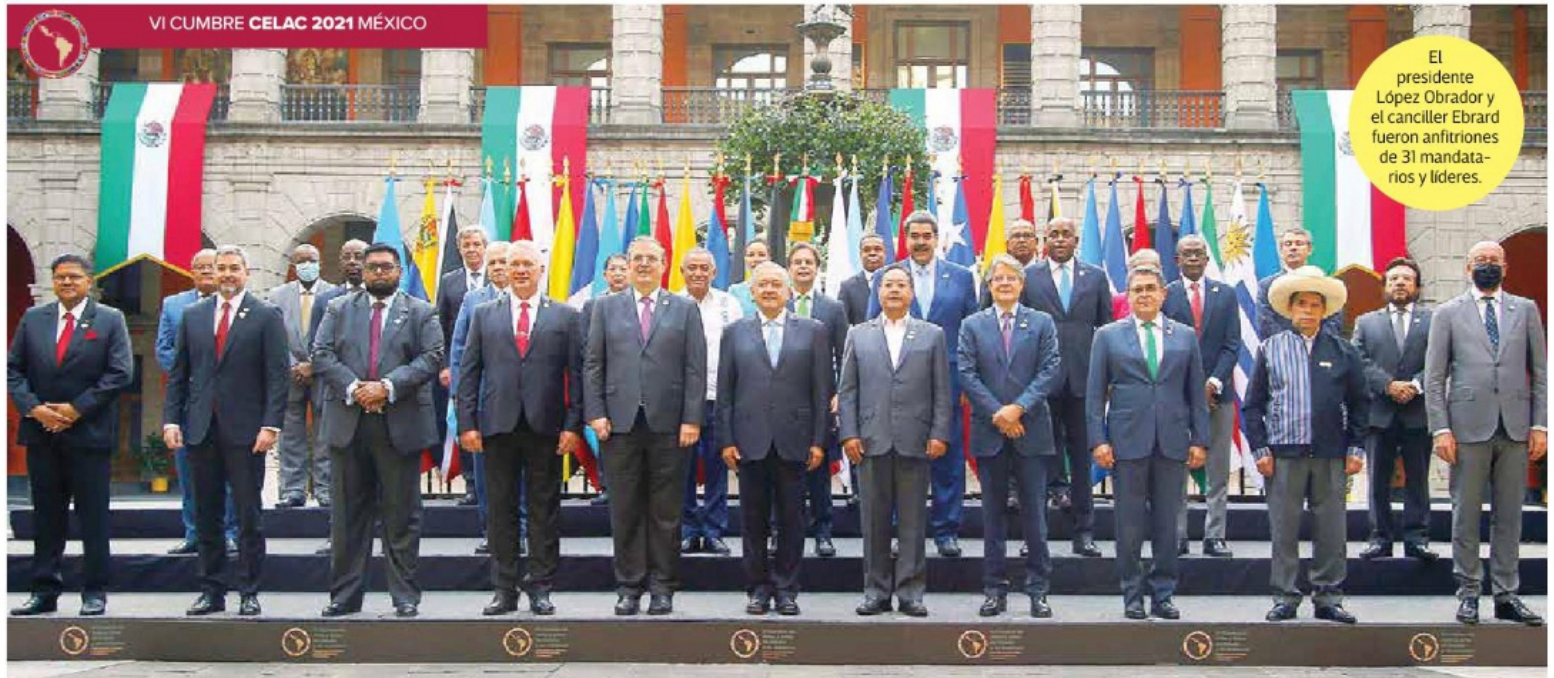
El presidente López Obrador y el canciller Ebrard fueron anfitriones de 31 mandatarios y líderes.