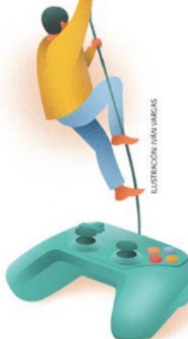
ILUSTRACIÓN IVAN VARGAS

Jugadores desarrollan habilidades que se han vuelto de alta demanda a partir de la pandemia de Covid. | A19 |