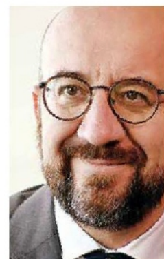
Charles Michel visitó México por la sexta cumbre de la Celac.

En entrevista exclusiva con Excelsior , en el marco de su visita a México para participar en la sexta cumbre de la Celac, afirmó que la Unión Europea tiene el mismo mensaje para todas las regiones, incluyendo América Latina: defenderá sus principios fundamentales —democracia liberal, derechos humanos, protección