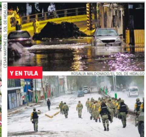
Y EN TULA