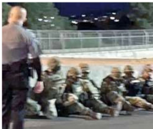
Los soldados fueron sometidos por agentes estadounidenses, tras cruzar la frontera entre Juárez y El Paso.

Los 14 soldados, su equipo y vehículos fueron devueltos a México alrededor de las 5:00 horas, aseguró la Oficina de Aduanas y Protección