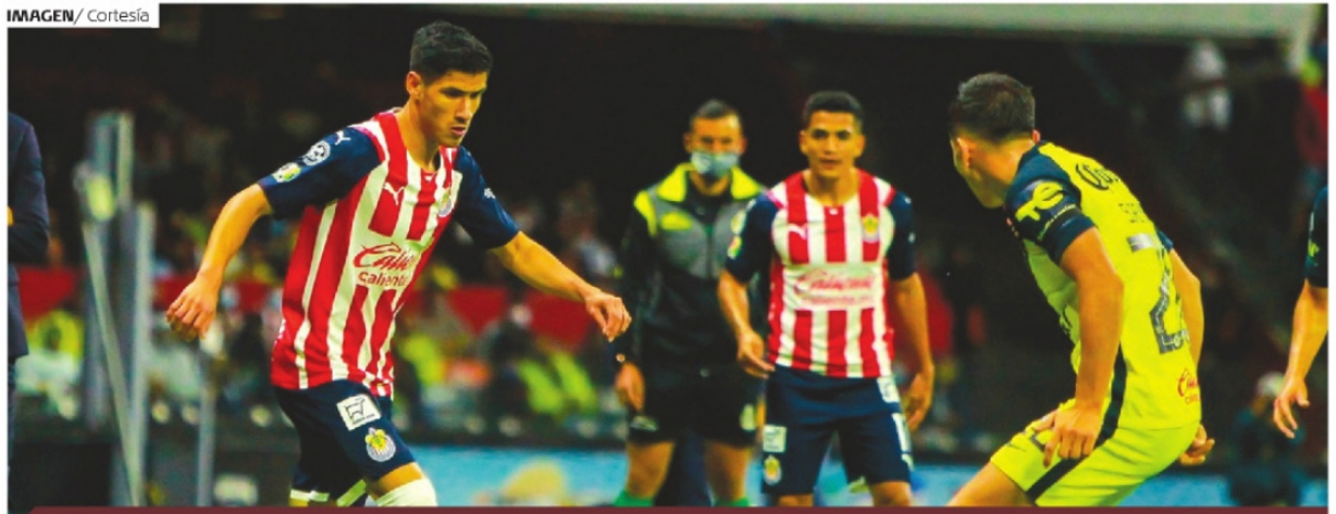
IMAGEN / Cortesía