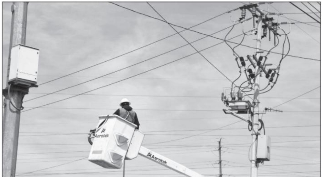
Un trabajador de la CFE

El neoliberalismo está en decadencia en el mundo. Por suerte también en México va de salida. Esperemos la aprobación de las reformas de la industria eléctrica para que no "se vaya la luz" o tengamos que pagar por ella más de 500% de súbito incremento en las tarifas, como está ocurriendo hoy en algunos países que se sienten "muy postmodernos". ■