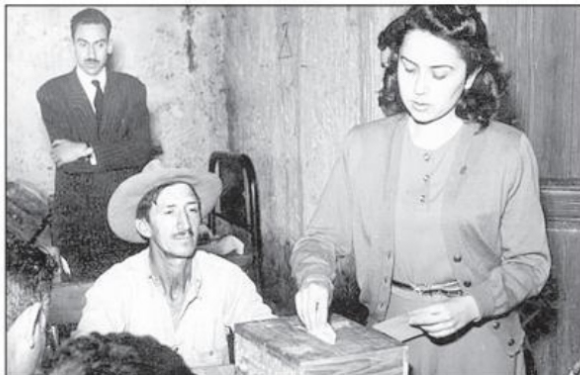
El derecho al voto, votar y ser votada, no fue una concesión que se le dio a las mujeres mexicanas; fue el resultado de una larga y organizada lucha por lograrlo.

Este es el contexto que debemos de traer al conmemorar el voto el 17 de octubre. Es una de las razones principales por las que creo que promover el voto entra las mujeres jóvenes, así como la inclusión de agendas que consideren a las mujeres y sus problemas es el siguiente paso en esta historia que hemos ido escribiendo en México. ■