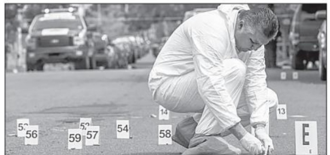
En un mes de este gobierno se rompió la cifra récord de homicidios dolosos con 220. Zacatecas es el estado con mayor tasa de víctimas de ese delito con 61.51 por cada 100 mil habitantes

El diagnóstico es correcto, la "herencia maldita" es real, y también es cierto que es pronto para esperar que el problema está resuelto. Del pasado no es responsable, y al futuro le cabe un "todavía". ¿Pero qué hay en el presente? ■