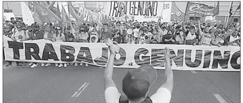
Los latinoamericanos ya no toleran los gobiernos que defienden los intereses de unos pocos, la concentración de la riqueza, la escasez de justicia, la debilidad de las garantías civiles y políticas, así como la tardanza en la construcción de garantías sociales