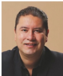
IVÁN DE SANTIAGO, político.

Muy pocos se bajaron del barco. El partido más popular del país ya gobierna Zacatecas y los que abandonaron los colores guindas están en un proceso de incertidumbre, con excepción de Enrique Laviada que agendó primero su diputación antes de declararse de Movimiento Ciudadano.