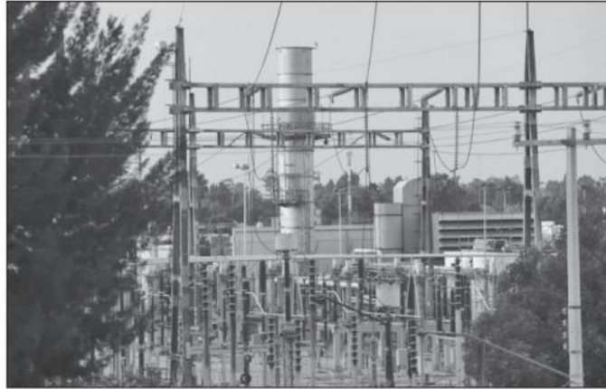
Torres de luz en la subestación Coapa, en la Ciudad de México

transfieran la energía a otras empresas de forma gratuita y subsidiada, lo que provoca inequidades que llegan al extremo de que las empresas más grandes paguen menos