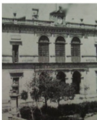
ALGUNOS inmuebles se utilizaron para distintas actividades.

Otro caso se relaciona a las constantes gestiones de sectores empresariales, comerciantes, hacendados, ganaderos, obreros y en sí la sociedad minera en su conjunto que se hacían ante los candidatos presidenciales, gobernantes, y demás que llegaban a esta comunidad, pretendiendo que se acercara a la ciudad la Estación del Ferrocarril.