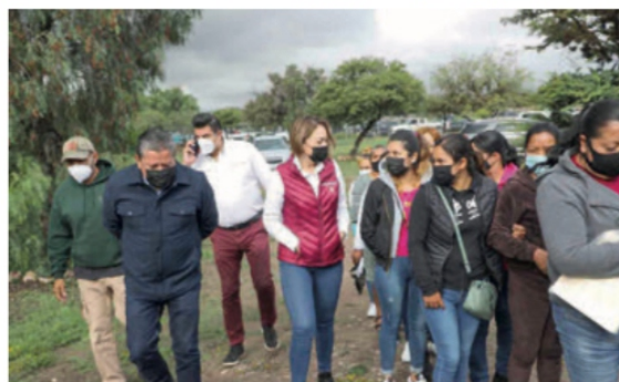
El Gobernador David Monreal y la Delegada de Programas para el Desarrollo encabezaron la entrega de Becas “Benito Juárez” para educación básica a 489 familias de comunidades de Pinos