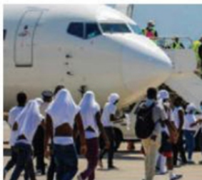
TESTIMONIOS EN LA CDMX

Rechazados. Entre el 19 de septiembre y el 1 de octubre, los servicios de migración de EU fletaron 57 aviones para expulsar de su territorio a 6,213 migrantes haitianos, según datos divulgados por la Organización Internacional para las Migraciones (OIM). En esos 13 días se produjeron cerca del triple de devoluciones a Haití por parte de las autoridades estadounidenses que en los siete meses y medio precedentes, de febrero a mediados de septiembre de 2021, periodo en el que 37 vuelos trasladaron a su país a 2,140 migrantes haitianos en situación irregular. PAG 16