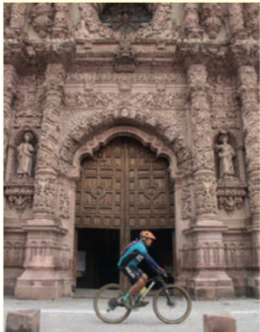
Participan más de mil ciclistas de 20 estados de la República Mexicana en La Marcha Zacatecas Bike 2021

Impulsa Gobernador David Monreal la Promoción del Turismo Deportivo y la Belleza de Zacatecas