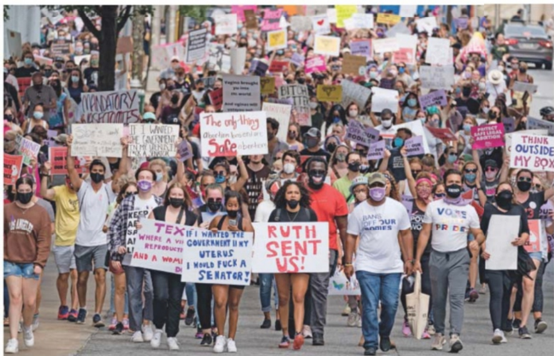
Miles de mujeres asistieron ayer a la manifestación en apoyo de los derechos reproductivos, en Atlanta, Georgia.

660 CONCENTRACIONES en todo EU se realizaron en apoyo de la libertad reproductiva.