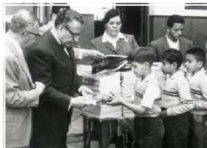
Entrega de libros de texto gratuitos a estudiantes.

Sin desestimar logros como la notoria reducción del analfabetismo, expertos opinan que la educación aún no es el gran igualador social al que aspiraba José Vasconcelos en 1921. / 10-13