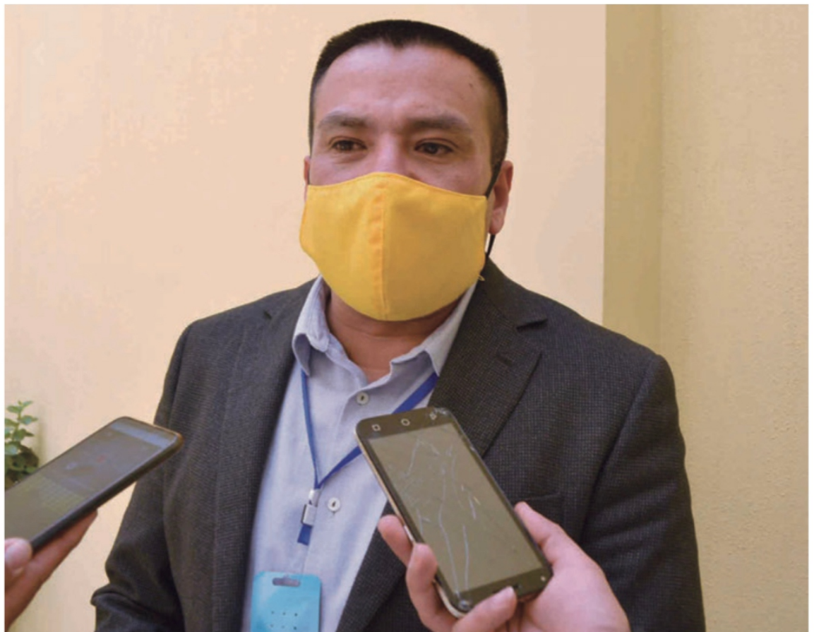
Eleuterio Ramos Leal, alcalde de Valparaíso