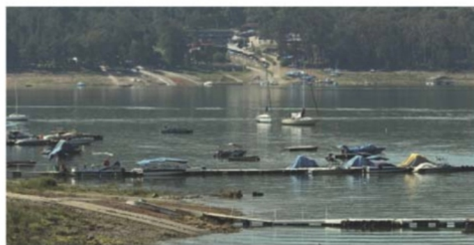
JOSÉ ALVARADO, EL UNIVERSAL

El Observatorio Ciudadano de la Subcuenca de Valle de Bravo denunció ante la Procuraduría Federal de Protección al Ambien-