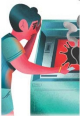
ILUSTRACIÓN: DANIEL DE LA VEGA, EL UNIVERSAL

El tradicional lago del Pueblo Mágico se encuentra a 60% de su capacidad.