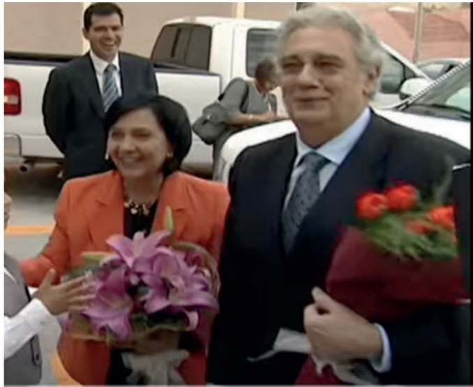
Amalia García Medina y Plácido Domingo