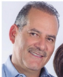
MARTÍN Orozco, gobernador de Aguascalientes.

La violencia es el problema más grave que tienen los gobiernos. Ayer se supo de un ataque a policías estatales en Villa García y ha trascendido que también hay graves problemas de inseguridad en Loreto. Por eso el gobierno de Aguascalientes advierte que está