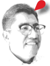
Saúl Monreal Ávila