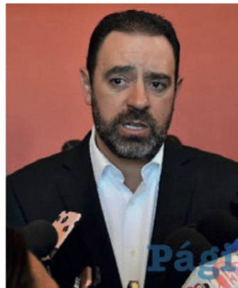
Alejandro Tello Cristerna