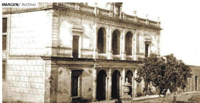
LOS CACIQUES aprovechaban su poder para gobernar Fresnillo.