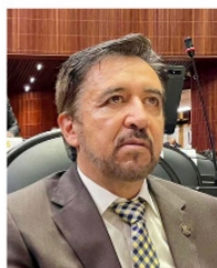
MIGUEL TORRES, diputado federal.

Hay quienes proponen un debate entre Femat y Benelly Hernández , de Morena, con Miguel Varela y Miguel Torres para discutir cuál es el verdadero trato que se le está dando a Zacatecas por parte de la Federación. Según Torres, el aumento en el presupuesto, que pasa de 26 mil 47 millones que programó la Federación este año, a 27 mil 420 millones de pesos para el 2020 será un porcentaje menor a la inflación que se vaya a tener. Los morenistas tienen otros datos.