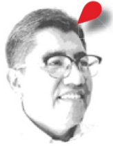
Saúl Monreal Ávila