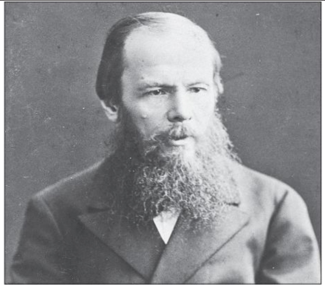
Fiodor Mijailovich Dostoievski

Cuando el embajador mexicano Alfonso Reyes reunía en la embajada mexicana en Buenos Aires a su alumno Jorge Luis Borges y ambos declamaban de memoria LA SUAVE PATRIA de Velarde o EL HIMNO DE LOS BOSQUES de Othón, -el potosino que siempre andaba pidiendo prestado y entre copas-, quizá intuían que ambos poetas calarían hondo en el desarrollo impresionante de las letras argentinas y, por ende, de la literatura en el mundo delirante.■