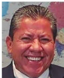
DAVID MONREAL ÁVILA, gobernador de Zacatecas.

Comerciantes del Centro Histórico de Zacatecas se ven agobiados por "los dos gobiernos". Por un lado tienen a grupos delincuenciales que ya están cobrando "derechos de piso", y por otro las contribuciones que se tienen que pagar a los gobiernos de