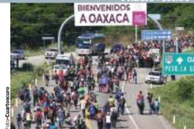
LA CARAVANA, al llegar a Los Corazones, Oaxaca, ayer.