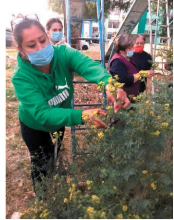
CON HUERTO Y ARTE "HACEN COMUNIDAD" EN JARDÍN DE LA PAZ. Mujeres de la comunidad aprenden de la importancia de tener un cultivo y propician la integración de los vecinos. Especial Pág. 3

La presidenta estatal de la Comisión detalló que en gran número de casos se trató de homicidios. Pág. 4