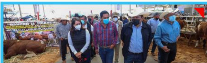
Benefician a productores a través del Tianguis Agropecuario Regional

Zacatecas, listo para la edición del 45 Tianguis Turístico de Mérida