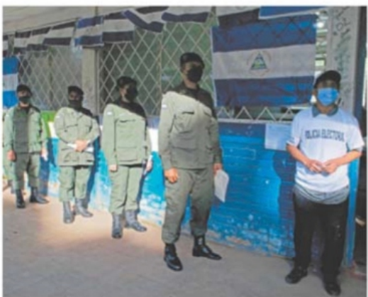
Soldados nicaragüenses esperaban ayer su turno en Managua para votar en las elecciones presidenciales.