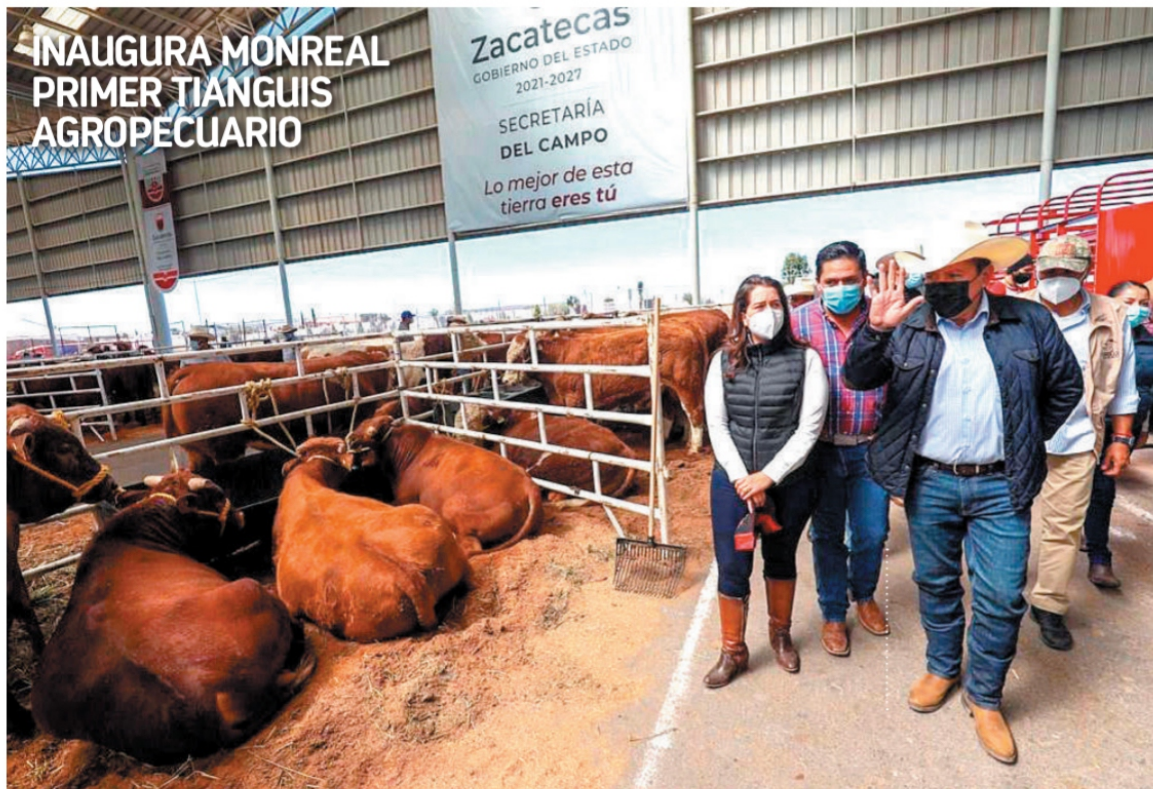
El gobernador de Zacatecas , David Monreal, entregó subsidios de hasta el 50 por ciento para insumos agrícolas y sementales; fue testigo del éxito de esta feria agrícola y pecuaria que contó con la presencia de campesinos y ganaderos de la región. Pág. 5 Especial

LA DIPUTADA LOCAL DEL PVEM Georgia Miranda impulsa una iniciativa a través de la cual pretende obligar a las dependencias públicas y empresas privadas a que respalden el derecho de las madres y sus hijos e hijas a la lactancia materna. La legisladora reconoce que al momento de dar alimento a sus bebés, las mujeres sufren de discriminación. Pág. 6