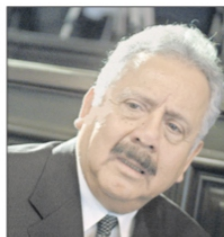
El político priísta fue el primer titular de la Reforma Agraria.