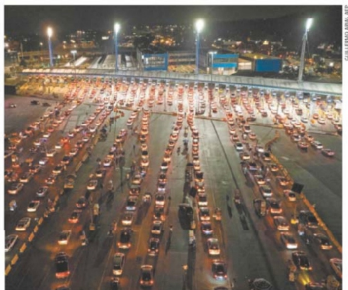
Largas filas de vehículos se formaron anoche en el lado mexicano de la frontera de Tijuana y San Ysidro, a la espera de que reabriera el paso para actividades no esenciales.