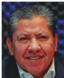
DAVID MONREAL, Gobernador de Zacatecas.

Con gran júbilo el gobernador David Monreal presumió la liberación de 200 millones de pesos recuperados del Fondo Minero. Ese dinero se lo tenían jineteadando a Zacatecas