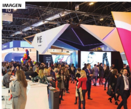
EL EVENTO ES UNO DE LOS MÁS importantes del mundo.

Como verá es abismal la seriedad que se le da al turismo en otros países donde si se valora lo que representa para su economía. Ojalá y que la presencia de Miguel Torruco sirva para iluminar su mente y finalmente se decida a trabajar por nuestro país sin tanta alabanza a su mesías tropical. hasta la próxima.