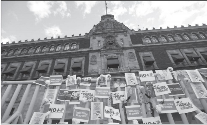
Carteles y fotografías en repudio a los asesinatos de periodistas a las afueras del Palacio Nacional, este martes