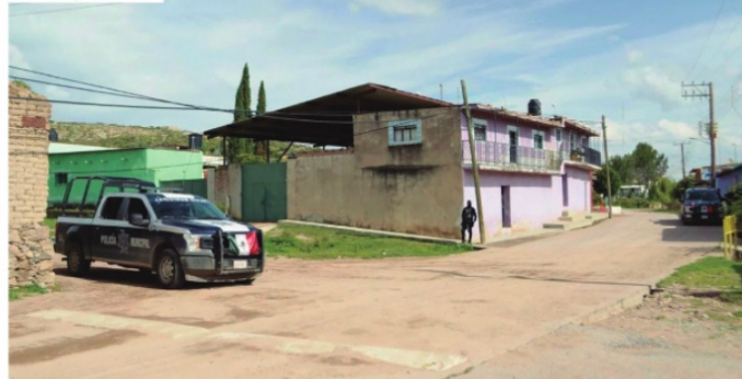
LA VIOLENCIA EN EL ESTADO ha desplazado a los habitantes de comunidades enteras.