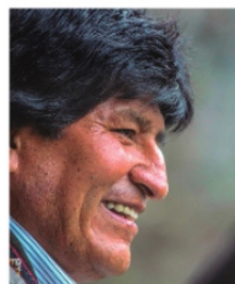
EVO MORALES fue presidente de Bolivia.