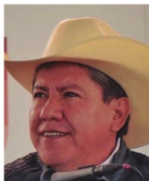
DAVID MONREAL, gobernador.

El mes pasado la Federación le cerró la puerta en las narices al gobierno de David Monreal . Se pretendía solicitar un adelanto de participaciones federales por 500 millones de pesos, con lo que quizá se hubieran apaciguado las aguas en el magisterio, que siguen exigiendo los