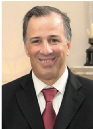
José Antonio Meade Kuribreña