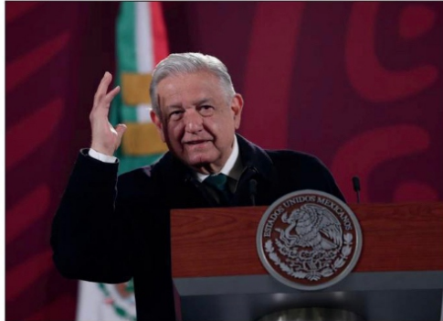
López Obrador, este jueves en Ciudad de México

tropezón mediático al salir a defender a Iberdrola, faltando a la verdad, unas semanas antes cuando la compañía eléctrica vació algunos embalses para poder vender como cara energía conseguida de la manera más barata. ¿Quién podía molestar más al presidente Sánchez que uno de los suyos siendo comprado por la empresa con la que estaba discutiendo?