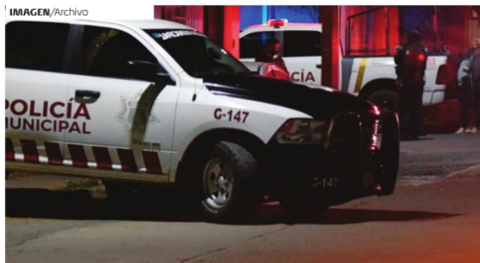
LA VIOLENCIA se intensifica con la punjan entre cárteles en el estado.