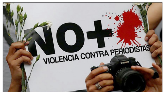
Según la Organización de las Naciones Unidas para la Educación, la Ciencia y la Cultura (UNESCO), México es el segundo país con más número de periodistas asesinados en el periodo de 1998 al 2021

El gobierno de Javier Duarte, que comenzó en diciembre de 2010 y finalizó el 30 de noviembre de 2016 en Veracruz, ha sido el más letal para los comunicadores: 18 periodistas asesinados/os (incluyendo al fotoperiodista Rubén Espinosa). Dicho estado tiene el mayor registro de asesinatos de periodistas, con 31.