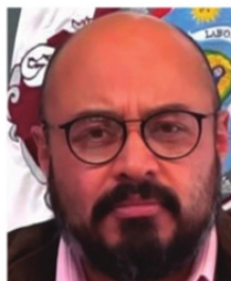
FRANCISCO MURILLO, Fiscal General.

Apenas el mes pasado, la Fiscalía estatal admitía de manera oficial que "por el momento no hay ni protocolos ni lineamientos para la protección de denunciante". Por ello no