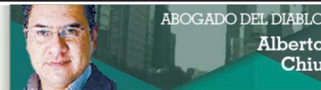
ABOGADO DEL DIABLO

El llamado es hoy para todos, para ponernos a trabajar aquí y ahora. Ni las autoridades, ni la sociedad, pueden ni deben quedarse callados ni cruzados de brazos. Ojalá no llegue a oídos sordos. Ni uno más