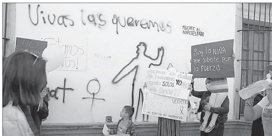
Las demandas sociales, las denuncias formales, la protesta en aire y tierra, pareciera ser evidente para todos los que pisen el suelo zacatecano, excepto para quienes despachan desde las oficinas localizadas en Plaza de Armas

del aparato gubernamental que le permite estar firme para que los relojes checadores no se queden sin entrada alguna.