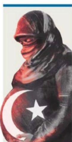
ILUSTRACIÓN: DANTE DE LA VEGA, EL UNIVERSAL