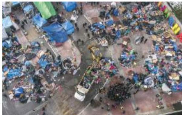
Desalojo del campamento migrante en El Chaparral, Tijuana, ayer.

EN SENTIDO contrario, la entrega de tarjetas de visitante creció 102%; ONG critican que sólo les den documentos hasta que se movilizan