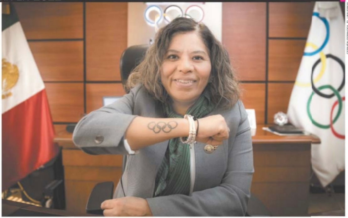
GERMAN ESPINOSA, EL UNIVERSAL