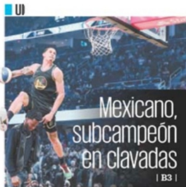
CHARLES RUIRA, AP