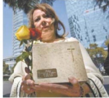
GERMAN ESPINOSA, EL UNIVERSAL