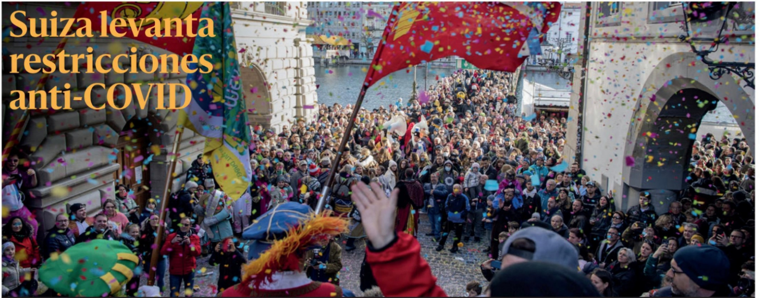
El tradicional desfile del carnaval de Lucerna, Suiza, se da en medio del levantamiento de la mayoría de las restricciones para frenar la pandemia por coronavirus que habían sido implantadas para grandes eventos públicos en Suiza.