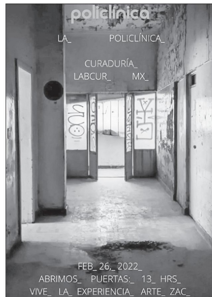
Cáctel de la exposición que se realizó en la Policlínica

Seguiremos platicando de ello en nuestra próxima colaboración.