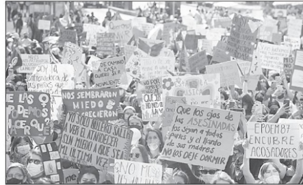
El 8 de marzo representa para nosotras, y miles de mujeres, a lo largo y ancho del mundo, el ejemplo digno de quienes en diferentes latitudes han levantado su voz para ganar derechos, o bien para defenderlos

papel sustancial en la selección de los mejores perfiles con capacidad y talento para conducir un proceso administrativo que reclama la mayor dedicación y empeño, estos son algunos de los elementos valorativos que entraña la Nueva Gobernanza.