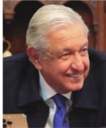
ANDRÉS MANUEL LÓPEZ OBRADOR presidente de México

Si el presidente Andrés Manuel López Obrador no les ofrece una solución a su problema, ¿quién lo puede hacer? Por eso hoy todavía insistirá una representación de más de 2 mil pobladores de comunidades de Jerez , que han sido desplazados de sus viviendas